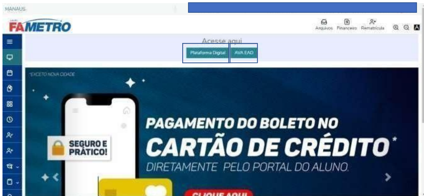
Figura 03- Visão do aluno (Portal do Aluno)

Na Plataforma Digital você encontrará as informações abaixo: