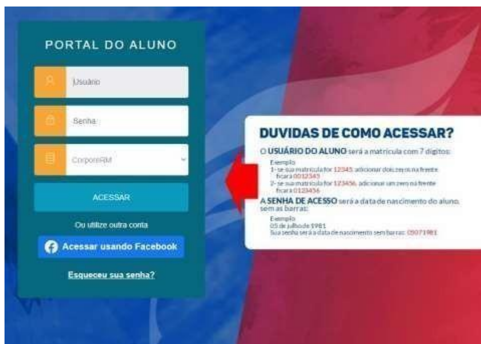
Figura 2 – Acesso ao Portal do Aluno

Você encontrar acesso a esses portais pelo site institucional: https://fametro.edu.br/ na aba PORTAL / ALUNO