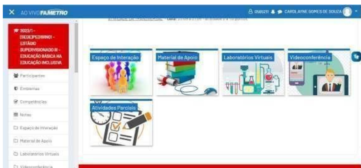
Figura 04- Visão do aluno (Plataforma Digital)